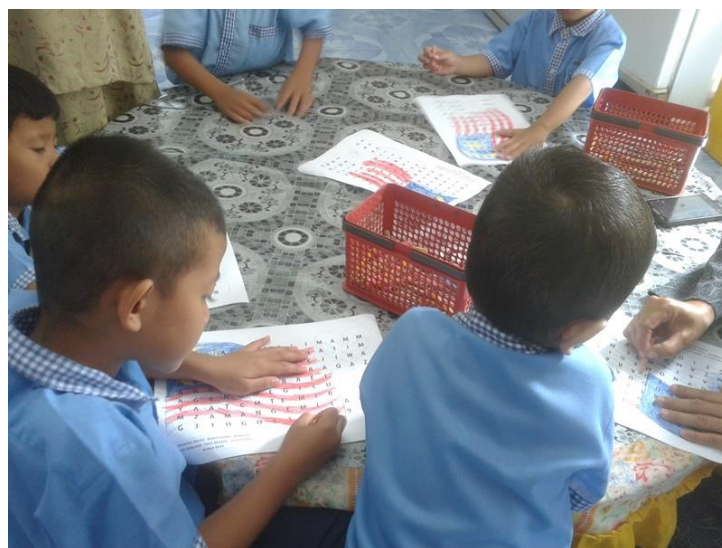
Aktiviti mewarna Jalur Gemilang