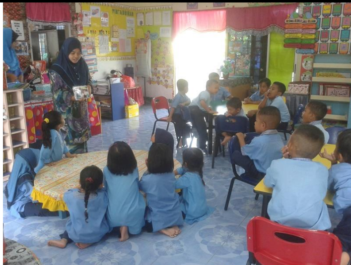
Keselamatan semasa melayari internet