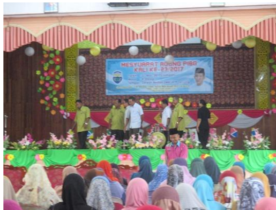
Antara tetamu VIP yang hadir