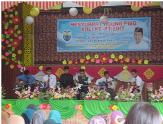
Persembahan dari pelajar