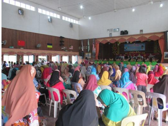
Kehadiran ibu bapa yang hadir ke Mesyuarat Agung PIBG