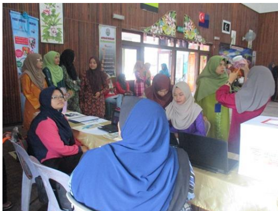
Staf PI1M yang menjaga kaunter