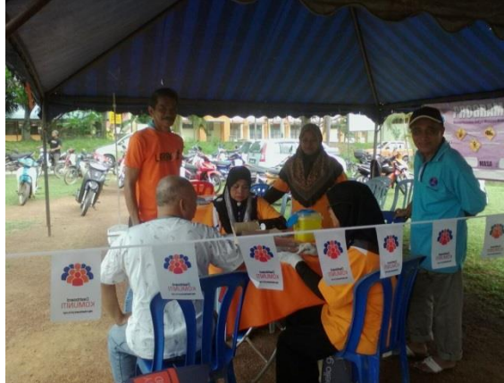
Pemeriksaan Kesihatan Bersama KOSPEN