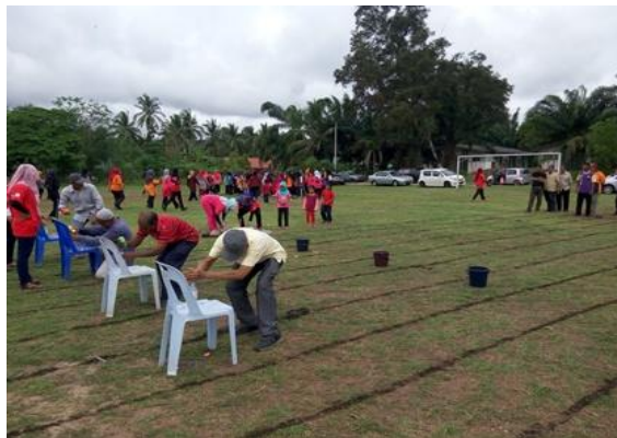
Acara Sukan Yang Dipertandingkan