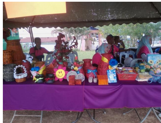
Pameran &amp; Jualan Produk Kraf Tangan PDK