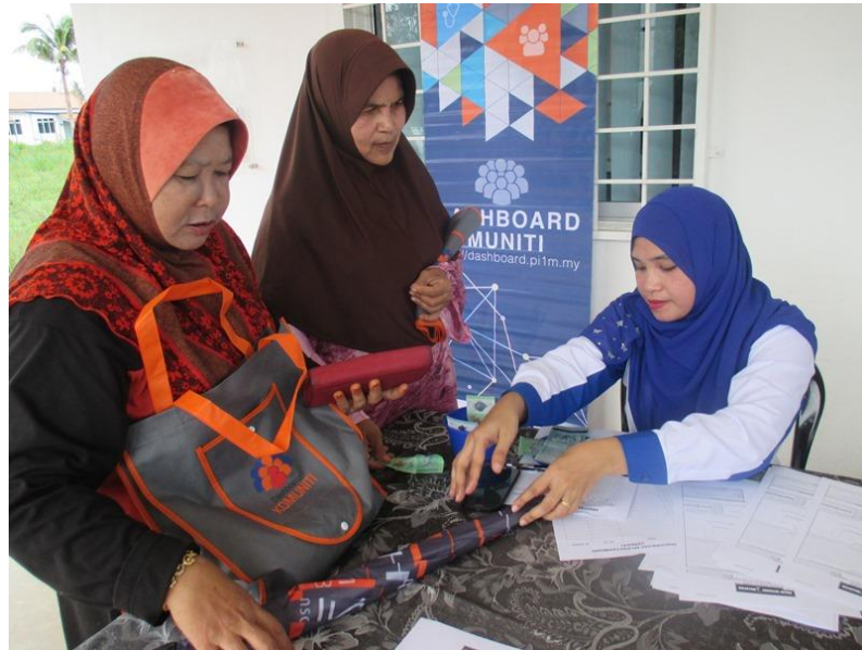
Pendaftaran Ahli Baru PI1M