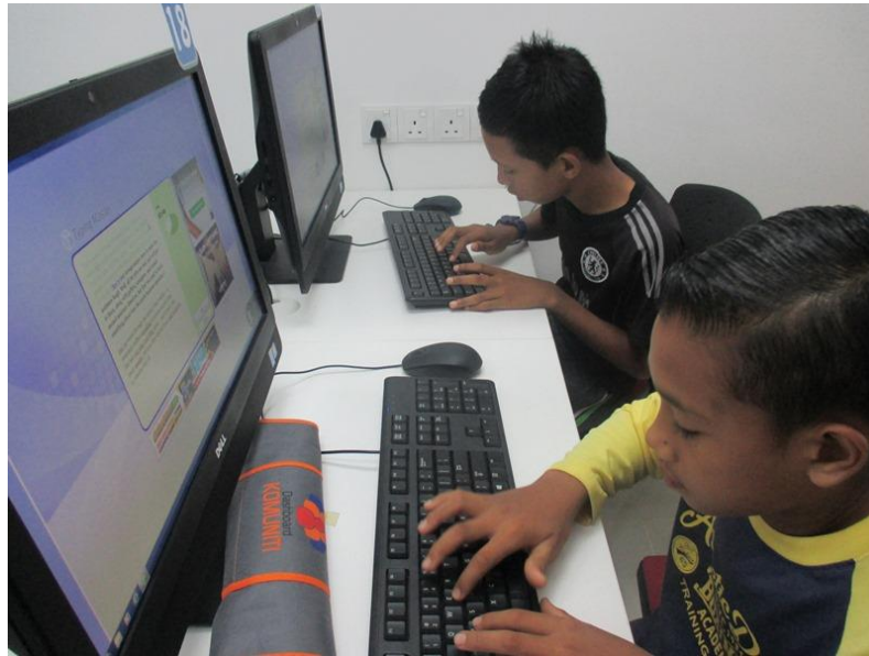
Aktiviti Menaip Pantas