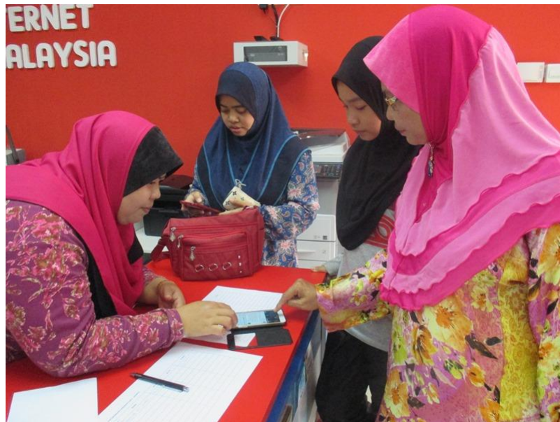
Install Apps Dashboard Komuniti di smartphone