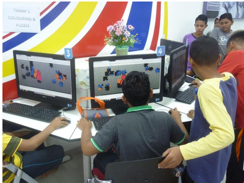
Pertandingan Puzzle untuk Pelajar Sekolah Rendah