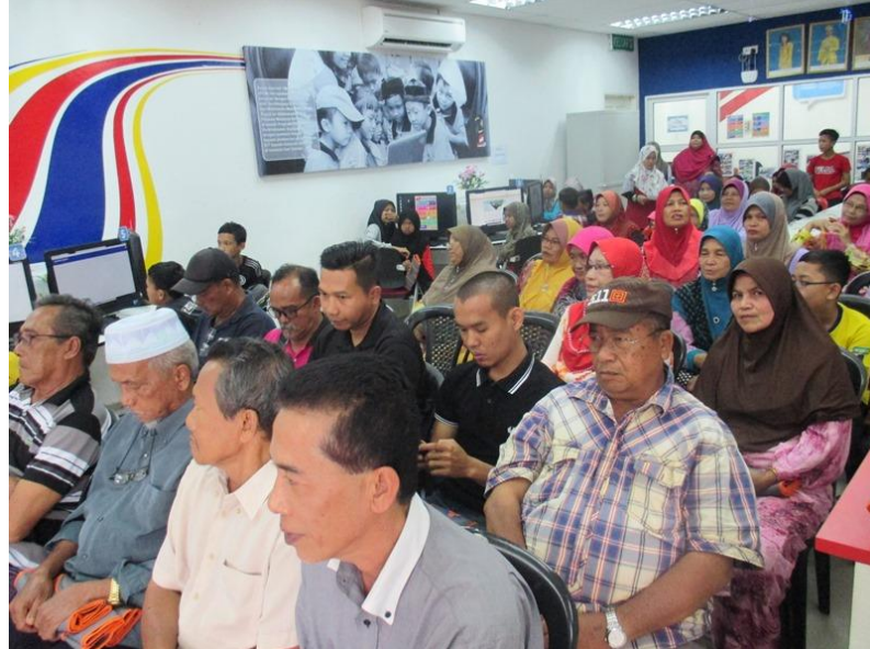
Pengunjung yang hadir ke Hari Dashboard Komuniti