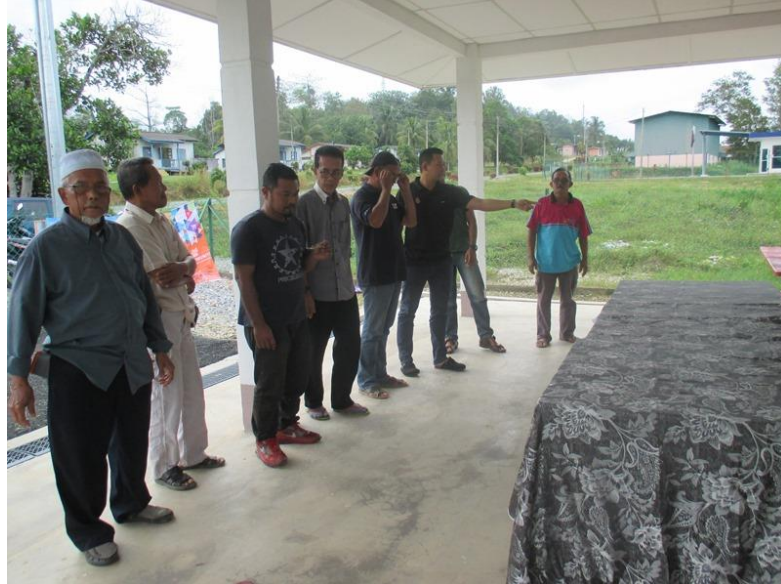
Acara Memasukkan Benang dalam Jarum