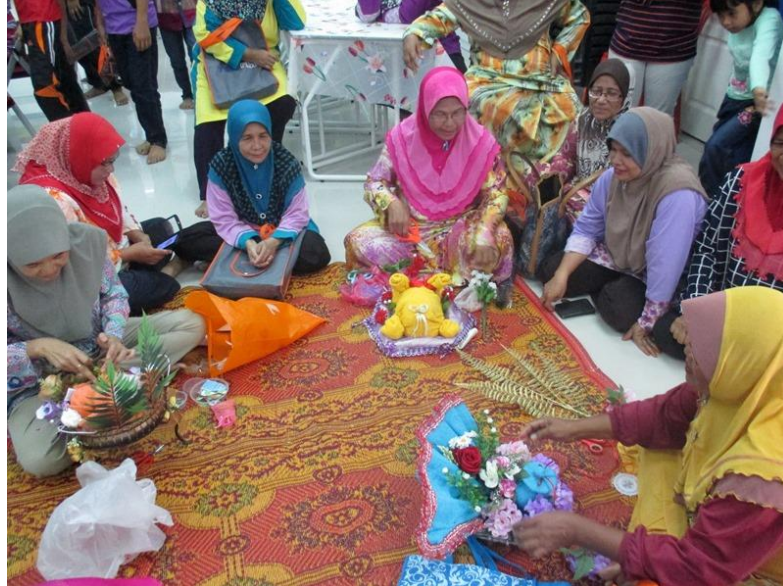
Peserta yang menyertai Pertandingan Gubahan Tuala