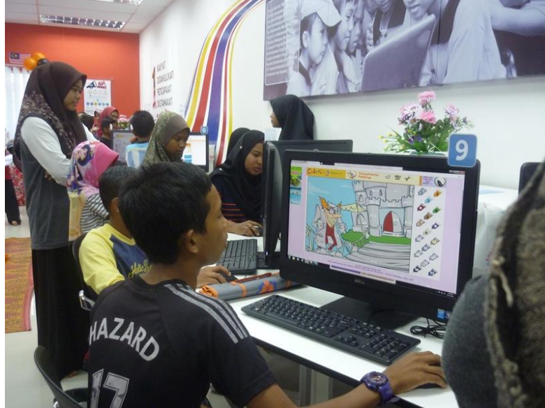
Online Coloring untuk Pelajar Sekolah Rendah