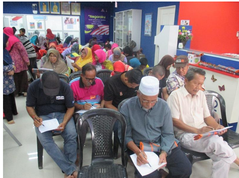
Acara Teka silangkata