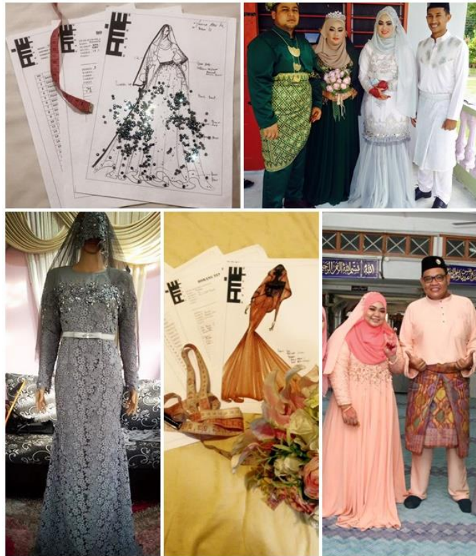
Antara produk bisnes Hasmerun