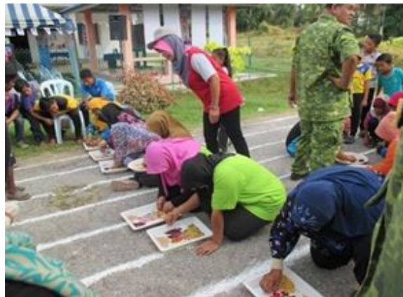
Acara Sukaneka 'Musang Berjantung'