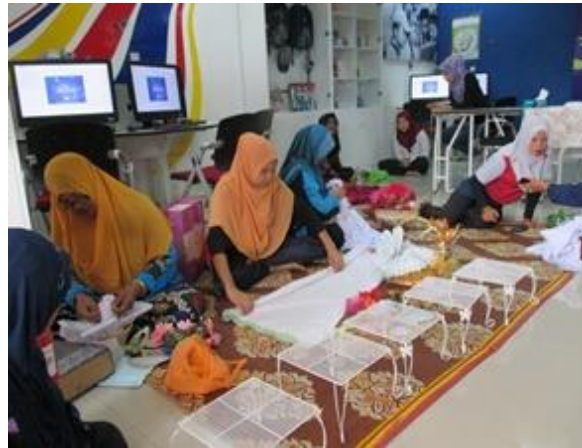
Pertandingan Gubahan Telekung