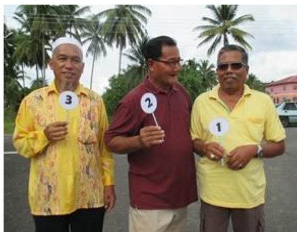
Pemenang Acara Sukaneka 'Masuk Benang Dalam Jarum'