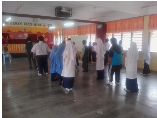
Permainan uji minda betul salah